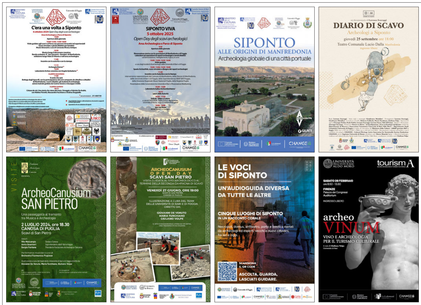
Fig. 6. - Una piccola selezione di iniziative di disseminazione e di coinvolgimento e partecipazione delle comunità locali: a-b) Open day degli scavi di Siponto; c) Fascicolo divulgativo sugli scavi di Siponto; d) Documentario Diario di scavo. Archeologi a Siponto ; e-f) Open day degli scavi di Canosa; g) Podcast Le voci di Siponto ; h) Convegno ArcheoVinum. Vino e archeologia per il turismo culturale .

e l'evocazione potente dei paesaggi sonori del tratturo. Uno specifico progetto del BAC, ColLABORare, si è concentrato sullo sviluppo di un metodo collaborativo per esplorare e documentare i paesaggi, in particolare in riferimento alle varie forme di lavoro e produzione nell'Italia meridionale: paesaggi delle saline di Margherita di Savoia, i paesaggi legati alla pesca e alle risorse marine a Taranto e i paesaggi argillosi e tufacei di Manfredonia e di Matera. Il modello punta a promuovere un processo partecipativo di costruzione di conoscenze condivise, attraverso laboratori di co-design di mappatura collaborativa.