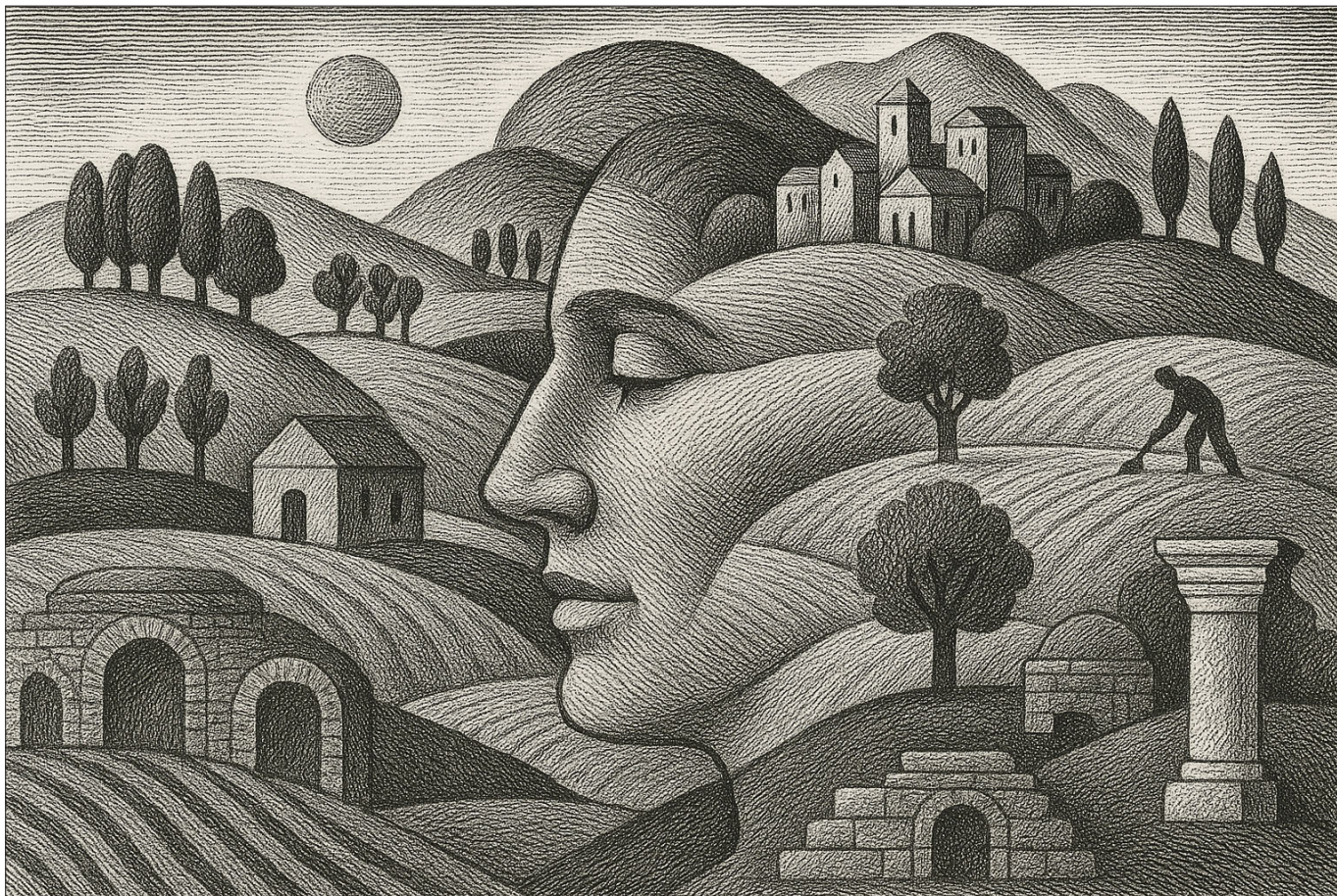
Fig. 1. - Paesaggi e persone. Elaborazione dell'autore con ChatGPT.

Oltre un centinaio di studiosi, tra affermati docenti universitari e ricercatori del CNR, ricercatori a tempo determinato, giovani assegnisti, dottorandi, borsisti e contrattisti.