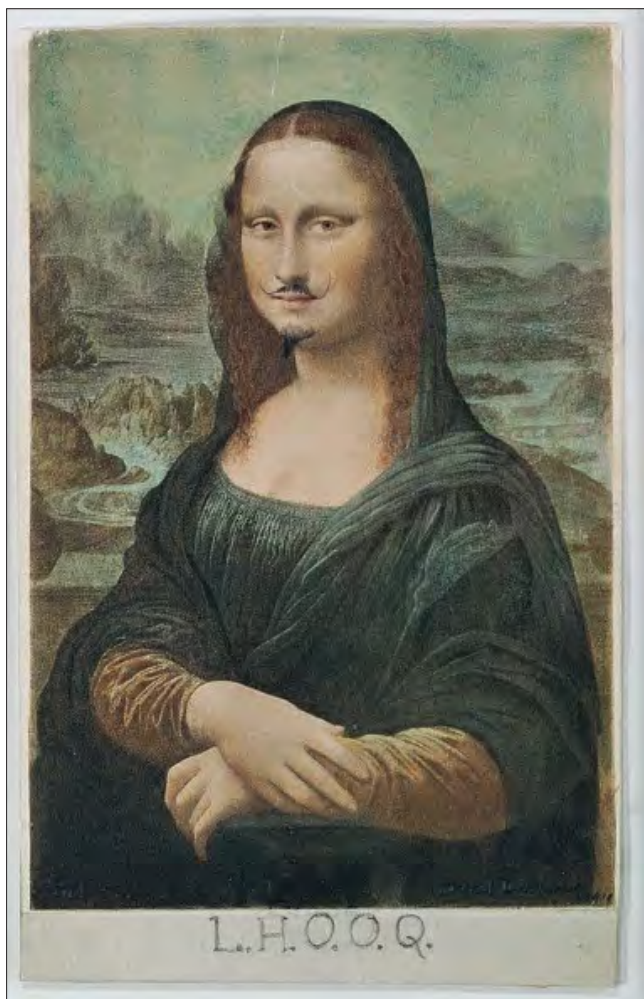
Arte o uso improprio dell'arte? La Gioconda nella versione di Marcel Duchamp.