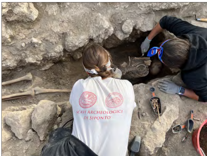
Resti scheletrici di un cimitero medievale in corso di scavo da parte di archeologi nel sito di Siponto (Manfredonia).

una comunità di cittadini che insieme a scienziati e decisori politici, sappia realizzare un uso competente della conoscenza e sia in grado di promuovere una riflessione sull'imprescindibile natura solidale di questa impresa» (p. 172).