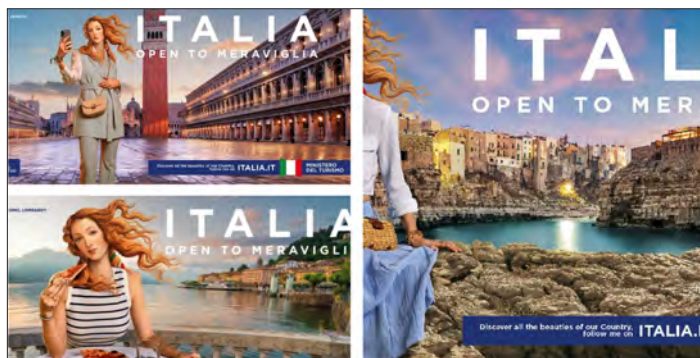
Publicità da scandalo 3: La Venere di Botticelli influencer nella campagna promozionale del Ministero del Turismo.

culturale, estesa anche all'immaterialità delle immagini. È quella che alcuni autorevoli giuristi hanno definito una "pseudoproprietà intellettuale", uno "pseudodiritto di sfruttamento commerciale" (Roberto Caso), un vero e proprio "mostro giuridico". Un diritto non solo presunto ma anche e soprattutto eterno.