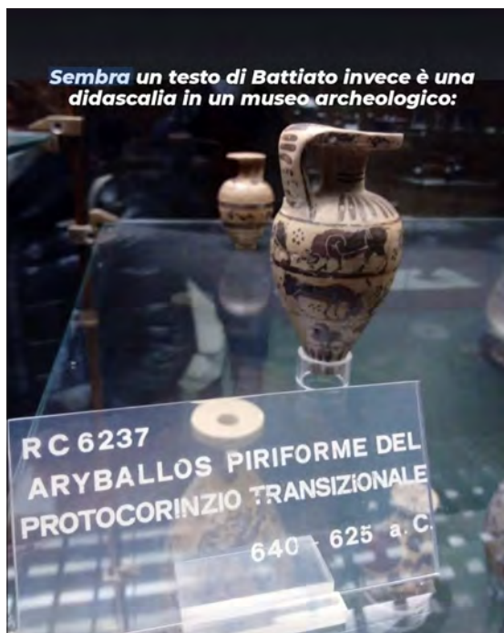
Una tipica didascalia da museo resa nota e commentata sul web.

capace di utilizzare strumenti e linguaggi nuovi e di rivolgersi ai diversi pubblici, favorendo il reale piacere della conoscenza e attivando processi di partecipazione dei cittadini. Una comunicazione inclusiva al servizio, però, di un progetto culturale capace di far comprendere la complessità del passato. Una comunicazione, peraltro, che sia una componente – e non l'unica – di un più articolato progetto di archeologia “pubblica”, intesa come archeologia