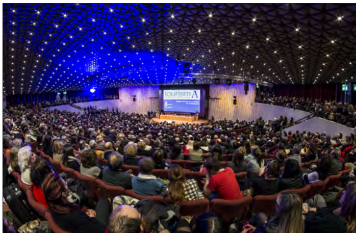
Archeologia pubblica: l'auditorium del Palacongressi di Firenze durante una delle ultime edizioni di "tourismA".

vale certamente per tutti i settori dei beni culturali – era rimasto lo stesso: aristocratico, autoreferenziale, indifferente al sapere del “popolo”. A un certo punto ci fu una sorpresa, dirompente, che nessuno si aspettava. Quando nel dicembre del 1980 al Museo archeologico nazionale di Firenze vennero esposti per la prima volta i Bronzi di Riace, rimessi a nuovo dai restauratori della Soprintendenza della Toscana, si formarono file interminabili e pazienti per poterli ammirare. Gente che attendeva per ore il suo turno (peggio che in un pronto soccorso!). Una cosa mai vista e che nessuno si aspettava (lo dimostrava l’assenza di ogni tipo di materiale informativo sugli eroi di Riace, che, avendolo immaginato, avrebbe fatto la fortuna di qualsiasi editore). Fu un punto di non ritorno nel rapporto fra