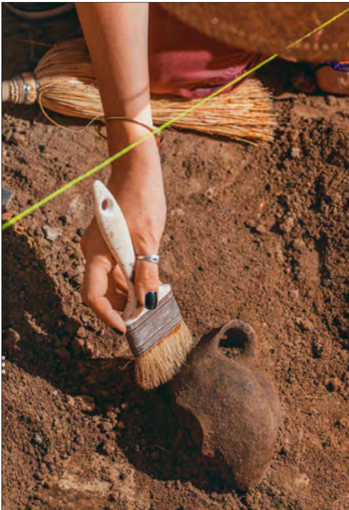
Archeologi al lavoro.