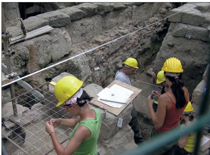
Studenti in scavo al Foro Romano.

intervento di archeologia preventiva o a un funzionario che si trova a gestire un'emergenza o che lavora alla pianificazione urbana e territoriale se ha conosciuto qualcosa di simile negli scavi didattici o di ricerca universitari.