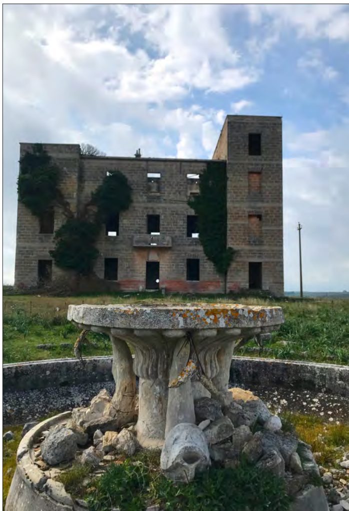
La palazzina del comando.