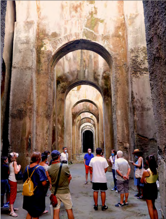
Visita in corso alla Piscina mirabilis di Bacoli (Na), un'enorme cisterna di acqua potabile per le esigenze della flotta romana nel vicino porto di Miseno. Per la sua gestione sono state selezionate alcune piccole realtà della cosiddetta "imprenditoria di prossimità".