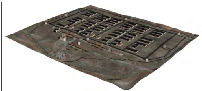
Una ricostruzione del campo.

non aveva fatto consumo di birra, mentre il 21% ne aveva consumata non più di 8 lattine e ben il 54% ne aveva fatto uso ancora maggiore. I dati materiali – i dati archeologici – emersero così con tutta la loro forza documentale.