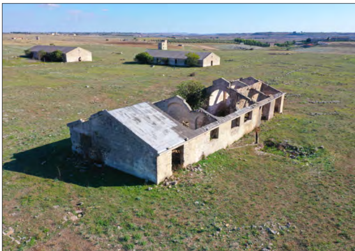
Alcune delle baracche residue.

introdotte pochi anni fa, non mancano incomprensioni e conflitti tra archeologi, architetti e storici dell'arte.