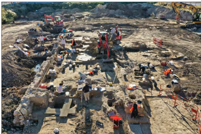
Un grande cantiere di archeologia preventiva in Francia.

di alcune norme in materia, siamo ancora ben lontani dalle esperienze di altri paesi europei, innanzitutto la Francia dove dal 2002 opera l'INRAP, un istituto pubblico con un budget di 150 milioni di euro e oltre duemila collaboratori (tra cui anche vari italiani), che fa ricerca, produce e pubblica dati, alimenta la conoscenza: mentre si realizzano le grandi opere, si modernizza il paese, si crea sviluppo.