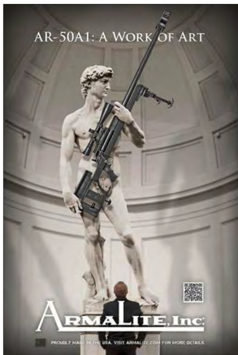
Publicità da scandalo: il David di Michelangelo utilizzato per reclamizzare armi.

corporativo concesso all'Accademia, rischiando di danneggiare quell'ampio comparto della libera ricerca (soprattutto in ambito umanistico), delle riviste divulgative o quelle promosse da associazioni, fondazioni, varie società? È cosa si intende poi, in questo ambito, per diritto di cronaca? Solo la notizia dell'ultima scoperta sensazionale, magari infarcita dalla nauseante retorica della bellezza?